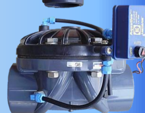
регулирующие промывочные клапаны